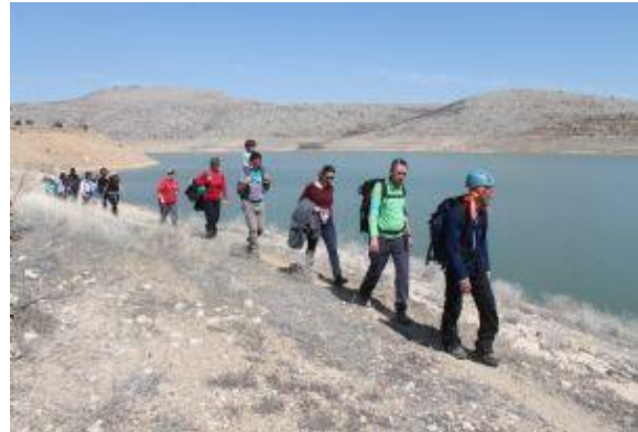
Şekil 4. KARDOF Gödet Barajı Gezisi

Gökçe köyü yakınındaki Gödet Barajı Karaman Doğa Sporları ve Fotoğrafçılık Derneği gezisine ev sahipliği yapmış olmakla beraber doğa yürüyüşlerinde de önemli bir potansiyele sahiptir.