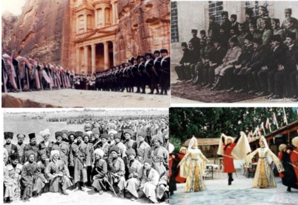
Şekill. Çerkes Kültürü

Çerkesler, Karadeniz'den Hazar Denizine kadar olan Kuzey Kafkasya topraklarında yaşayan halkların ortak adıdır. (Ersoy H, 1992). Çerkes grubunu oluşturan halklar kendi içlerinde Adıge, Abaza, Çeçen, Lezgi, Karaçay gibi çeşitli adlar alırlar. Çerkes toplumu, Khabze adı verilen kurallarla yönetilir, Khabze, etimolojik olarak; dışarının, alanın, çevrenin, aşağısının dili, şablonu, düzeni demektir. Çocuğın doğumundan itibaren büyüüp yetişmesine, yaşlanıp ölmesine kadar, insan hayatını düzenleyen ve güzelleştiren çeşitli seramonyel kurallar vardır. Bunlar, modern sosyolojideki görgü kurallarından, gelenek ve göreneklere, örf, adet ve töre kurallarından ahlak ve din kurallarına, hatta maddi yaptırımlarla perçinlenen hukuk kurallarına kadar bütün sosyal kuralları kapsarlar. Genel olarak misafirperverliği, temeli saygıya dayalı kuralları çerçevesinde Çerkeslerin folklorunu yaşattığı ve bunu asimilasyona karşı korumaya çalıştığı bir süreç yaşanmaktadır.