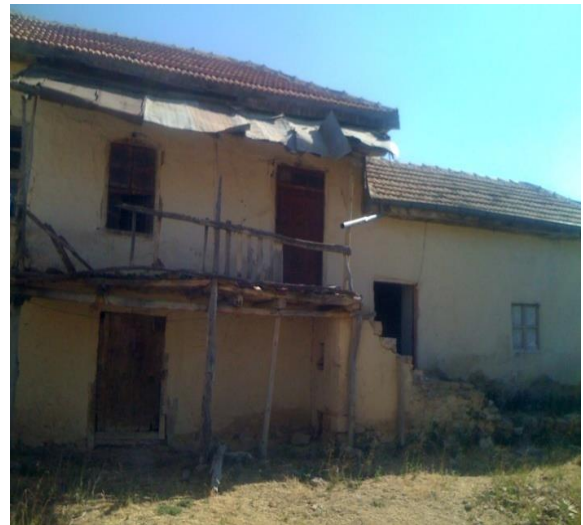
Şekil7.Yerel Mimariyi Yansıtan Bir Yapı

Yerel mimari özgünlüğünü koruyan çok az yapı bulunmakla beraber çoğu harabe ve kötü durumdadır. Yeni yapılan evler kırsal mimariye uygun olmamaktadır. Yerel mimariyi yansıtan evlerin restore edilmesi ve korunması önerilmektedir. Örnek olarak gösterilen yerel özgün mimari yapının içerisinde ahşap detaylar görülmekte ve kırsal turizmde ilgi çekeceği düşünülmektedir.