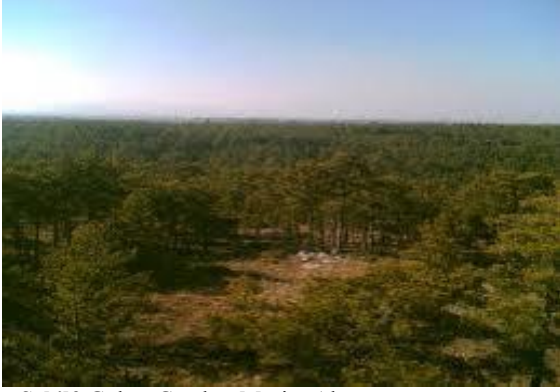
Şekil2.Gökçe Çamlığı Mesire Alanı

Çevre düzeni planında da yer alan bilgilerin ışığında vurgulamak gerekir ki, Gökçe Çerkes Köyü önemli bir kırsal turizm potansiyeline sahiptir. Ayrıca Gökçe Köyü belirlenen Planlama Bölgesi'nde önerilen yeterince kullanılmayan turizm potansiyelinin değerlendirilmesi amacı ile bölgedeki önemli tarihi ve doğal değerler arasında kültürel tur güzergâhlarının içerisinde yer alıp tam merkezinde bulunmaktadır.Plan ile üç ana güzergâh belirlenmiştir.Bu güzergâhlardan ilki, Silifke İlçe Merkezi'nden başlayıp; İmamlı ve