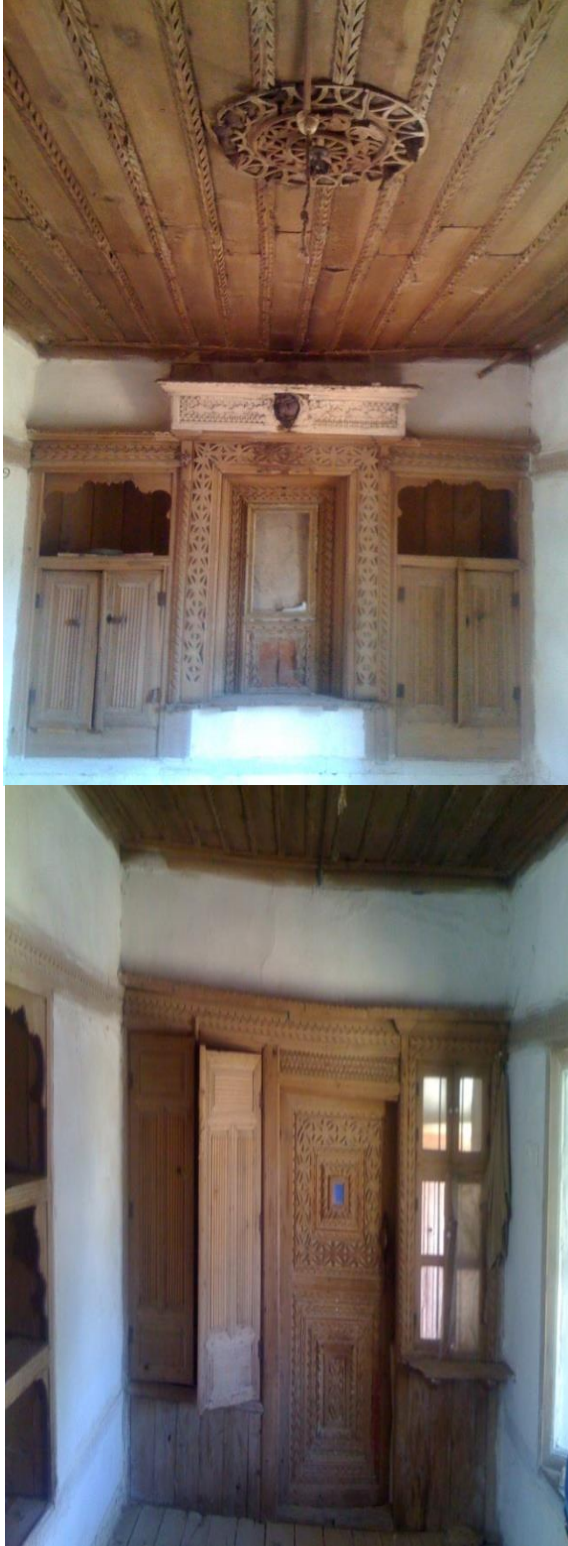
Şekil 8. Yerel Mimari Yapı İçerisindeki Ahşap Dolap ve Kapı Detayları