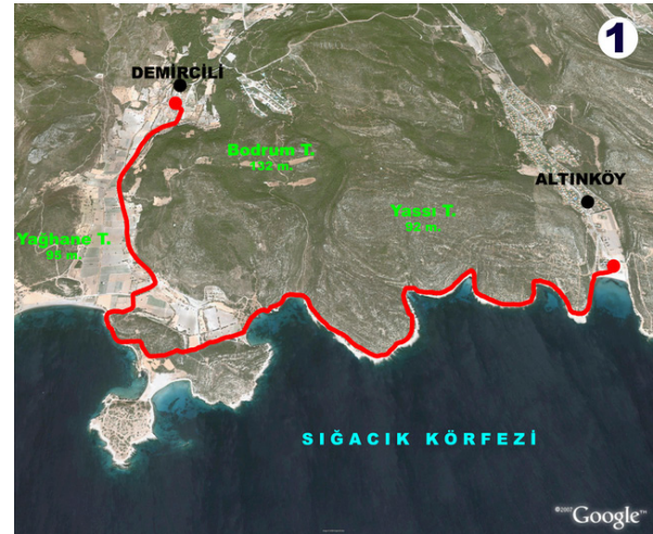
Şekil 6: Demircili - Altınky ekoturizm gzergahı

Şekilde (Şekil 7) belirlenen iki numaralı gzergah iin Urla'nın sahip olduđu bir ok deđer ve kaynak beraber kullanılmıř, ok eřitli ve uygulanabilirliđi yksek bir eko turizm gzergahı oluřturulmuřtur. Gzergahın bařlangı noktası olarak İskele Mahallesi seilmiřtir. Burada sabah saatlerinde kendine zg bir Őekilde her sabah aılan balık mezatına uđrayarak, yerel bir zellik turistlerin kullanımına kazandırılmaya alıřılmıřtır. Buradan sonra Urla iin olduka nemli bir isim olan Yorgo Seferis'in yařadıđı ev ziyaret amacıyla gzergaha alınmıřtır. Nobel dll bir yazarın Urla iin yaratacađı turistik deđer bu Őekilde uygulanabilirlik kazanmıřtır. Buradan ayrılarak Urla'nın sahip olduđu bir bařka deđer olan Zeytinyađı İřliđi'ne uđranmıřtır. Anadolu zerinde tarihte bilinen ilk zeytinyađı fabrikası olarak gn yzne ıkarılmıř bu yer, restorasyonları ve alıřmaları tamamlanarak orjinalinin birebir aynısı olarak tekrar hayata geirilmiřtir. Hatta son olarak buradan 2600 yıl nceki tekniklerle tekrar zeytinyađı elde etme yoluna gidilmiřtir. Bylesine nemli bir tarihi deđer de eko turizm ierisine dahil edilerek Urla'nın bu alandaki gc ortaya konmaya alıřılmıřtır. Daha sonra