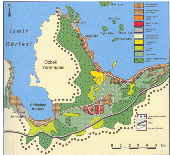
Şekil 3: Urla'da genel arazi kullanımı (Emekli,2005).

İlçe'nin bir Merkez Belediyesi, Merkez Belediyesi'ne bağlı 23 mahallesi ve 14 köyü bulunmaktadır (Şekil 4). Köylerin coğrafi dağılımına baktığımızda; kuzey kıyılarındaki Özbek, güney kıyılarındaki Zeytinler, Uzunkuyu, Zeytinler, Demircili, Yağcılar, Bademler, Gölçük, batı kıyılarındaki Balıklıova, Kadıovacık, Barbaros, Birgi, Nohutalan, Gülbahçe ve merkeze yakın olan Kuşçular ile Ovacık köyleri olarak sıralayabiliriz. 2004 yılı itibari ile kabul edilen 5216 sayılı yasa ile idari sınırların değişmesi ile, Özbek ve Gülbahçe köyleri mahalle statüsü kazanmıştır.