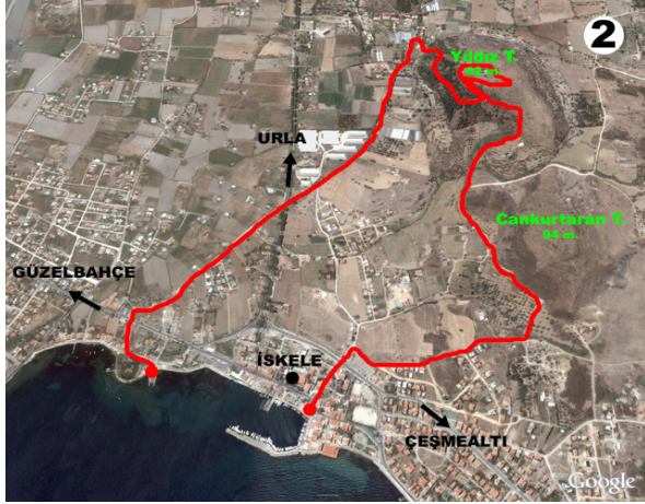
Şekil 7: Urla İskele ekoturizm güzergahı

içinde tırmanışın da olduğu Şehitlik Tepesi olarak da bilinen Yıldız Tepe'ye doğru bir yol izlenmiştir. Burada hem manzara özellikleri hem de orman içinde yürüyüş yapılarak turistlerin spor yapması da düşünülmüştür. Tepeden indikten sonra varış noktası olarak Limantepe arkeolojik kazı alanı seçilmiş ve buradaki tarihi değer güzergaha kazandırılmaya çalışılmıştır. Böylelikle kültür-doğa, kent-kır bütünleştirilerek turistlere sunulması düşünülmüştür.