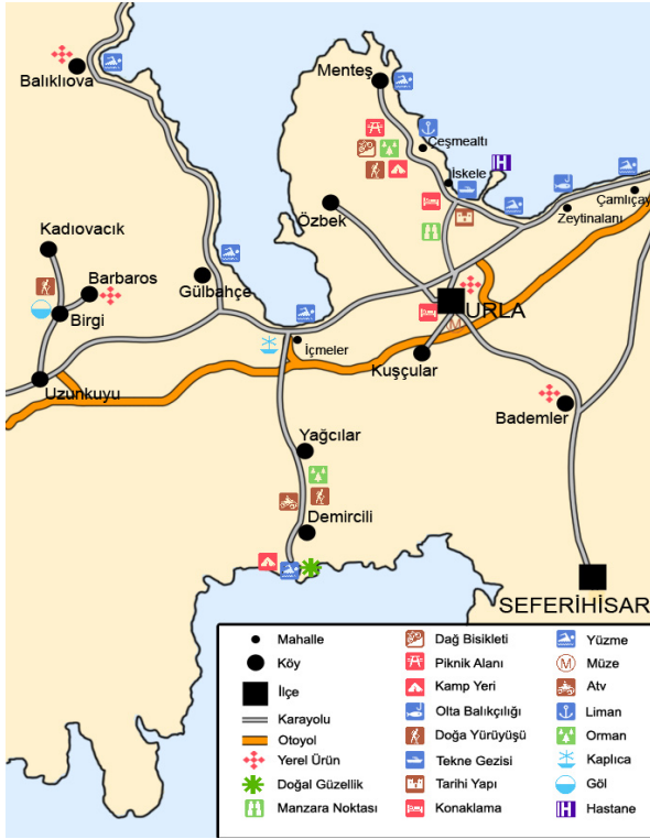
Şekil 5: Urla'da turizm olanakları

yapılan yreye zg yemekler misafirlere sunulmaktadır. İledeki bir diđer çiftlik de Rahatla At Çiftliđi'dir. Burayı tercih eden gnbirlikiler bařta olmak zere tm turistler, zellikle atların ve diđer hayvanların olduđu dođal ortama gelip, şehrin yođun temposunu geride bırakarak rahatlamak istemekte, Urla'nın kırsal yaşamını yerinde yařayarak farklı bir deneyim yařamak istemektedirler.