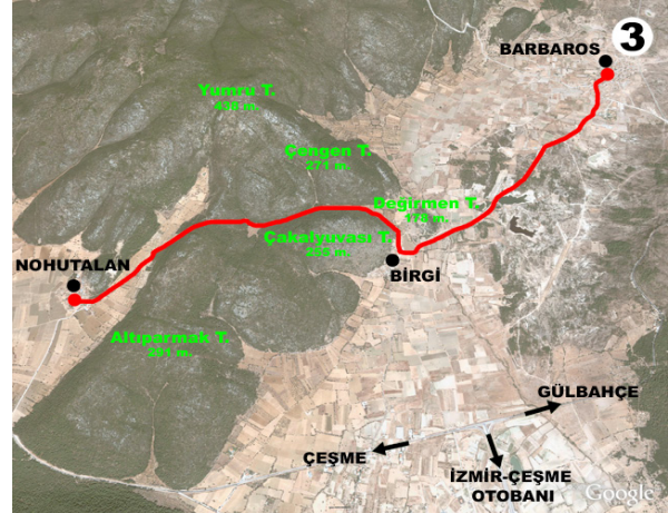
Şekil 8: Nohutalan - Barbaros Köyü ekoturizm güzergahı

Urla'nın sahip olduğu tarihi ve doğal güzelliklerinin çeşitli turizm faaliyetlerinde kullanılabilmesi, ancak ilçedeki sosyo-ekonomik gelişme açısından en doğru seçeneklerin başında kırsal turizmin geldiği yadsınamaz bir gerçektir. Çünkü Urla'nın kıyı kesimlerinde deniz-güneş-kum hakimiyeti devam etmekte, bu durum turizmin belli bir noktada ve belli bir mevsimde gerçekleşmesine neden olmaktadır. Oysa kırsal turizmde mevsim kavramı yoktur ve turizmin yılın her döneminde gerçekleşmesine olanak tanımaktadır. Ayrıca kıyılarıdaki yoğunluğa karşın ilçenin diğer alanlarında turizmin gerçekleşmesini sağlayarak, turizmin coğrafi dağılımında denge unsuru oluşturmaktadır. İlçede yapılan diğer turizm faaliyetleri ile entegre olarak daha etkin bir ekonomik kaynak oluşturmaktadır. Kırsal turizmde turist profilinin diğer turizm türlerinden farklı olduğu çeşitli çalışmalarla belirlenmiştir. Bu durum kırsal turizmin doğal çevre ve