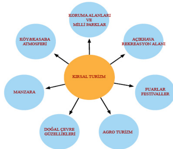
Şekil 1: kırsal turizm çekicilikleri

Bu turizm türünde yerel ürünlerin tüketilmesi, konaklamanın yerele özgü şekilde gerçekleştirilmesi, yerel halkın maksimum seviyede sosyo-ekonomik fayda sağlaması amaçlandığından, kırsal turizmin ile kırsal kalkınmada önemli bir saç ayağı oluşturduğu söylenebilir. Bunun yanı sıra; kırsal alanlara özgü gelenek ve göreneklerin