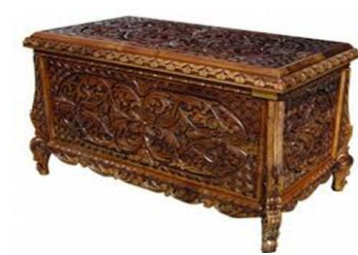
Kahramanmaraş Oyma Ceviz Sandığı