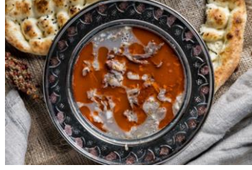
Maras Kelle Paçası