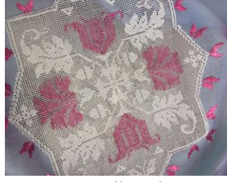
Maraş File Nakışı