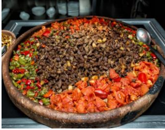
Maras Eli Böğünde/Maras Yanyana