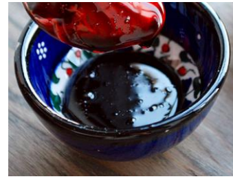
Maras Sumak Ekşisi Akıtı