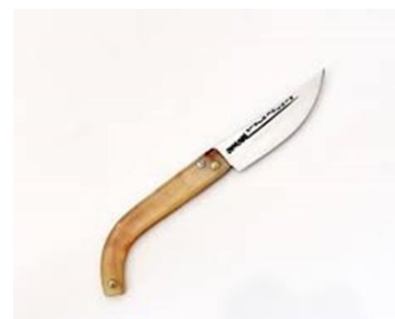
Kahramanmaraş Hartlap Bıçağı