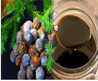
Andırın Andız Pekmezi