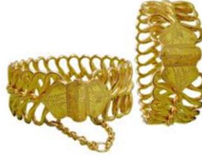
Maraş Burma Bileziği