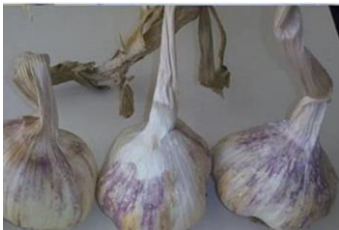
Afşin Koçovası Sarımsağı