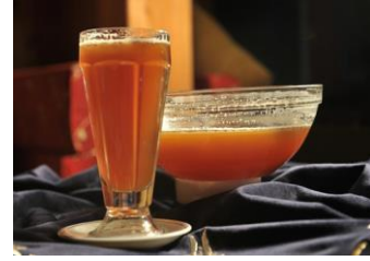
Maras Ravanda Şerbeti