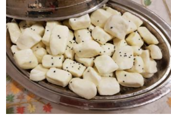
Maras Parmak/Sıkma Peyniri