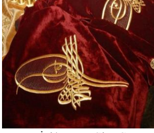
Maraş İşi/Maraş Sim Sırma