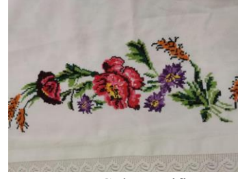
Maraş Gülü Motifi