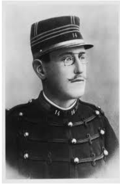
Resim 1. Yüzbaşı Alfred Dreyfus

Aleyhinde delil olmamasına rağmen, sadece bir yazı benzerliğinden yola çıkılarak 15 Ekim 1894'te tutuklanan Yüzbaşı Alfred Dreyfus (Resim 1) çok zengin Yahudi bir ailenin başarılı çocuğu olarak orduya tayin edilmişti. Hiçbir zaman maddi sıkıntısı olmayan ve mutlu evliliği ilk çocuğuyla daha da perçinlenen yüzbaşının önünde, kendi deyimiyle son derece parlak ve kolay bir kariyer açılmıştı (Dreyfus, 1901).