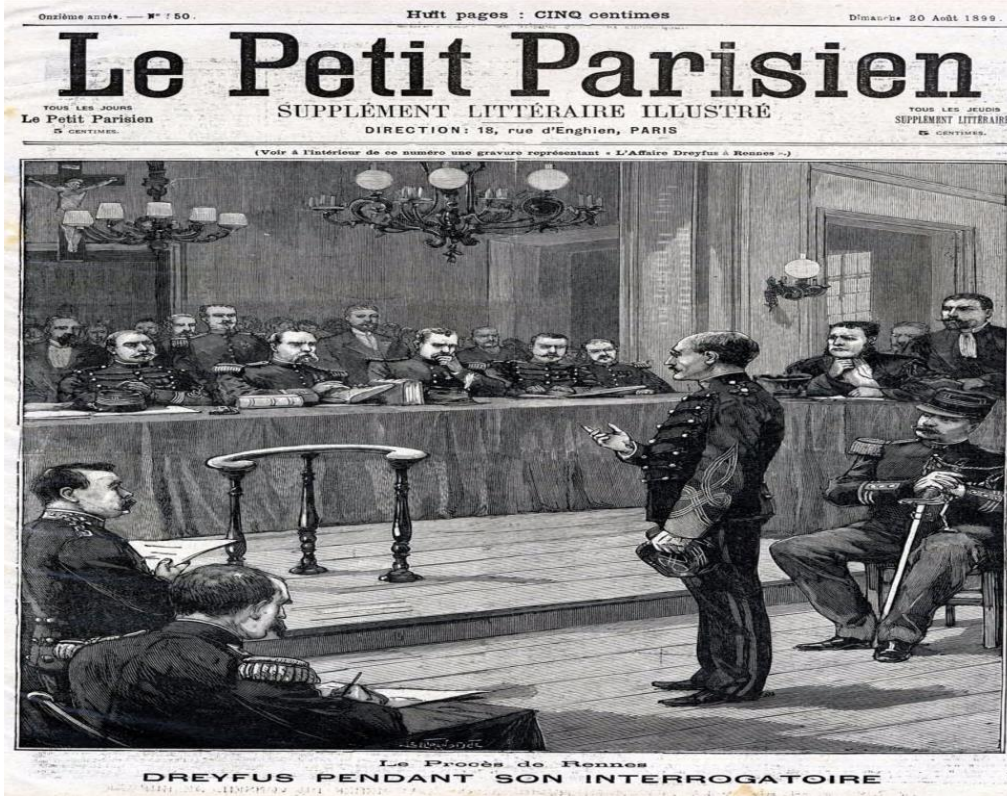
Resim 5. Dreyfus sorgusu sırasında. Le Petit Parisien gazetesi (20 Ağustos 1899).

Nitekim, her türlü lehte savunmaya rağmen ikinci mahkemenin sonunda yine mahkeme Dreyfus’u suçlu buldu (Resim 5). Suç “düşmanla gizli haberleşme” olarak tarif edilmiş ve “hafifletici nedenlerle” ikiye karşı beş oyla, 10 yıl hapse hüküm giydiği belirtilmişti.