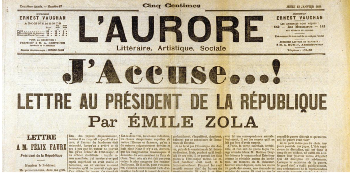
Resim 4. Émile Zola'nın "Suçluyorum!" başlıklı cesur makalesi, L'Aurore 13 Ocak 1898

Emile Zola'nın makalesi, Dreyfus'un haksız bir biçimde cezalandırılmasından açıkça suçlu olan Esterhazy'nin gerçekdışı savunmasıyla beraat ettiği duruşmadan yalnızca iki gün sonra basılmıştı ve gazete sadece Paris'te birkaç saat içerisinde iki yüz binden fazla satmıştı. Makalede hiç işlemediği halde Dreyfus'un nasıl suçlu durumuna düşürüldüğünü anlatan Zola'nın aklında iki amacı vardı: İlki; halkı Dreyfus davasının lehinde yönlendirebilmek, diğeri de resmi otoriteleri provoke ederek, kendisini suçlamalarını sağlamak, dolayısıyla; ortaya çıkacak yeni mahkeme ile de halkın ilgisini Esterhazy'nin suçlu, Dreyfus'un ise suçsuz olduğu fikrine doğru kaydırmaktı. Gerçekten de Zola bunu başardı ve Fransa'yı titreten bir tartışmayı başlatarak, kamuoyunun ilgisini Dreyfus'un lehine çevirdi (Wilkes, 1998). Zola, 'Suçluyorum' u yazarken suç işlediğinin farkındaydı. Basın Yasası'nın hangi maddelerini ihlal ettiğini bildirerek kendini ihbar etmiş, "kolaysa beni ağır cezada yargılayın" diyerek meydan okumuştur (Tekay Baysan, 2002).