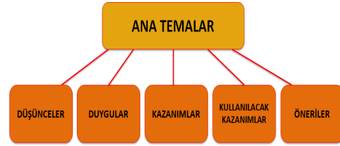
Şekil 1: Empati Eğitimi ile İlgili Ana Temalar

Katılımcıların empati eğitimi ile ilgili olarak ana temalardaki referans sıklığına bakıldığında ise, ‘Çalışma İçin Öneriler’ de %6.25, ‘Düşüncelerde %15.63, ‘Kullanılacak Kazanımlarda %15.63, ‘Kazanımlarda % 26.99 iken ‘Duygular’ ana temasında %35.51 olarak tespit edilmiştir. Farkındalık ve üst biliş odaklı empati eğitiminin en fazla etkisi katılımcıların duygularına olan etkisi olarak netlik kazanmıştır. Bu sonuca göre katılımcılar çalışma ile ilgili geribildirimlerinde en sık duygu ifadeleri kullanmışlardır. Bir diğer anlamda geribildirimlerinde duygusal ifadeler daha çok başvurarak, olumlu ve olumsuz görüşlerini bu şekilde dile getirmişlerdir. Duyguların arkasından en fazla bahsedilen ana konu ise kazanımlar kısmıdır.