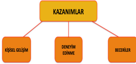
Şekil 4: Empati Eğitimi ile İlgili Kazanımların Alt Temaları

Detaylı olarak incelendiğinde okul yöneticilerinin ve öğretmenlerinin farkındalık ve üst biliş odaklı empati eğitimi ile ilgili kazanımlarının referans sıklıkları belirlenmiştir. Empati eğitimi ile ilgili olarak katılımcılar kazanımlarının en fazla Yeni beceriler elde etmekte (% 54,29) olduğunu belirtmişlerdir. İkinci önemli kazanım ise % 37,14 ile yeni deneyimler elde ettikleridir. Kişisel gelişim konusunda ise %8,57’lik bir kazanımları olduklarını dile getirmişlerdir.