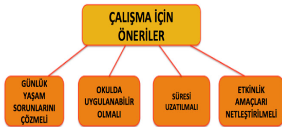
Şekil 6: Empati Eğitimi ile İlgili Önerilerin Alt Temaları

Üst biliş ve farkındalığın oluşturulup, okul kültür ve ekosisteminin değiştirilmesi için okul yöneticileri ve öğretmenler proje hakkındaki önerilerinin incelenmiştir. Alt temalardaki referans sıklığı en yüksek %40 ile eğitimin Süresi Uzatılması olmuşken onu %30 ile Okul Uygulamalarına Uygun Hale Getirilmesi izlemiştir. Daha sonra %20 ile Etkinlik Amaçları Netleştirilmesi ve %10 ile Günlük Yaşam Sorunlarına Değ-