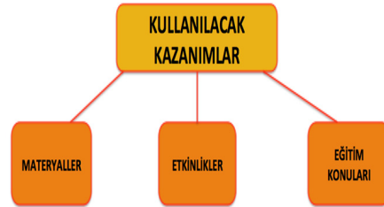
Şekil 5: Empati Eğitimi ile İlgili Kullanılacak Kazanımların Alt Temaları

Kullanılacak Kazanımlar daha detaylı olarak incelendiğinde okul kültürünü ve ekosistemi değiştirecek olan farkındalık ve üst bilişin özellikle uygulanabilecek ve kullanılabilir kazanımlarla olması mümkündür. Farkındalık ve üst biliş odaklı empati eğitimi ile okul yöneticilerinin ve öğretmenlerin kullanılacak kazanımlarının referans sıklıkları incelendiğinde empati eğitimi ile ilgili olarak katılımcıların projeden kazandıklarını hangilerini kullanacaklarına ait alt temalardaki referans sıklığı en yüksek %69,23 ile Etkinlikler olmuşken onu %23,08 ile Materyaller ve %7,69 ile Eğitim Konuları alt temaları izlemiştir. Böylelikle sonraki durumlarda katılımcılar proje sayesinde öğrendikleri etkinlikleri uygulayacaklarını, materyalleri kullanacaklarını dile getirmiş ve yeni eğitim konuları öğrendiklerini de ayrıca ifade etmişlerdir.