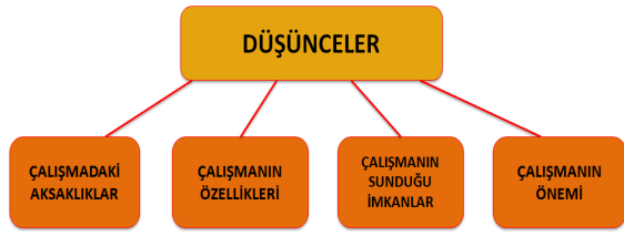
Şekil 2: Empati Eğitimi ile İlgili Düşüncelerinin Alt Temaları

Okul yönetimi ve öğretmenlerin farkındalık ve üst biliş odaklı empati eğitimi ile ilgili olarak dört alt tema altında düşüncelerini detaylandırmışlardır. Veri analizi sonucunda elde edilen referans sıklıklarına göre katılımcıların empati eğitimi ile ilgili düşünceler kategorisinin alt temalarında elde edilen sonuçlar en az %8,62 ile Çalışmadaki Aksaklıklarda ortaya çıkmıştır. Çalışmanın Öneminde %20,69 iken Çalışmanın Özelliklerinde %27,59, 'Çalışmanın Sunduğu İmkânlarda % 43,10 ile en yüksek yüzde dağılımı görülmüştür. Bu noktada katılımcılar proje hakkındaki düşüncelerini dile getirirken en fazla çalışmanın sunduğu imkânlardan bahsetmişlerdir.