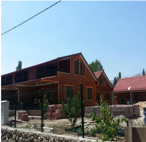
Resim 3. Sagalassos Yaylakent Evleri Projesi Batı Akdeniz Kalkınma Ajansı tarafından finanse edilen TR61/12 TRZMİ/0002 referans numaralı 2012 Alternatif turizm geliştirilmesi mali destek programı kapsamında desteklenmiştir.