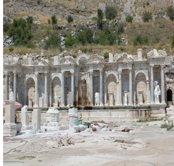
Resim 1. Sagalassos Antik Kentten görünüm (Antoninler Çeşmesi)

Burdur ilinin, Ağlasun ilçesinin Yeşilbaşköy'ü doğal güzelliği, Burdur-Isparta-Antalya illerine ve bölgedeki diğer alternatif turizm türlerine yakınlığı nedeniyle kırsal turizm açısından önemli bir yere sahiptir. Yörede bulunan Sagalassos Yaylakent Evleri, Tarihi Yeşilbaşköy Su Değirmeni ve Ağlasun ilçe sınırları içinde bulunan TaTuTa çiftliği kırsal turizm açısından önemlidir. Bunun yanı sıra Ağlasun ilçesinde 54 odalı, 108 yatak kapasiteli otel yeni faaliyete geçmiştir. Müşterilerinin çoğunluğu orta yaşın üzerinde Fransız ve Belçikalı müşteriler oluşturmaktadır. Otelin bahçesinde göz alabildiğince uzanan organik sebze bahçesi mevcuttur, buradan toplanan ürünler müşterilere ikram edilmektedir.