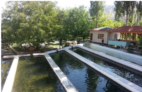
Resim 5. Alabalık tesisinden görünüm

Her üç işletmeye de kaç yıllık deneyime sahip olduklarının tespiti amacıyla yöneltilen soruya, iki işletmenin de yaklaşık 25 yıllık ve üçüncü işletmenin ise 1 yıllık bir geçmişe sahip olduğu anlaşılmıştır. Bu işletmeler köyün çıkışında olup, Alanlar Alabalık Restaurant ve Pansiyon, Onur Alabalık Tesisi ve Sagalassos Yaylakent Evleridir.