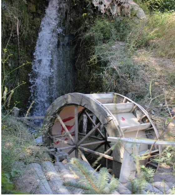
Resim 2. Tarihi Yeşilbaşköy Su Değirmeni, Değirmen Turizme dönüyor projesi Batı Akdeniz Kalkınma Ajansı tarafından finanse edilen TR61/11/Turizm/Kamu/01-04 referans numaralı 2011 Turizm yılı potansiyelinin değerlendirilmesi mali destek programı kapsamında desteklenmiştir.

Antalya'dan gelen turlar Ağlasun ilçesindeki Sagalassos Antik Kent'i ziyaret etmekte ve dönüşte Yeşilbaşköy'de mola vererek balık yenilmektedir. Meyve bahçesi içerisinde olan bu yerlerde müşteriler ağaçlardan meyve toplayarak yemektirler. Bu tür uygulamalar müşteriler açısından çok beğeni kazanmaktadır.