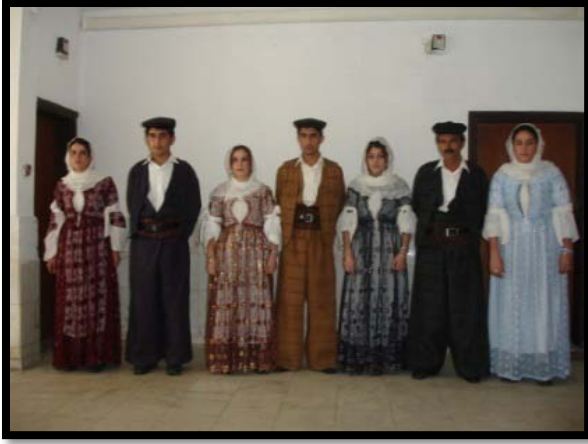
Şekil 10. Şırnak Yöresel Giysiler