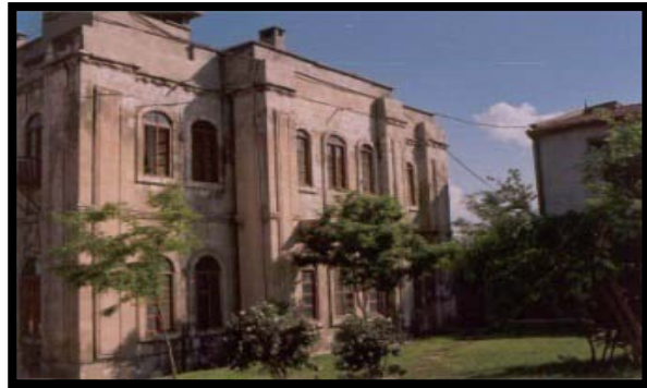
Şekil 9.Hamidiye Kışlası