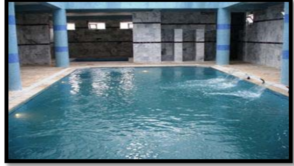
Şekil 7. Zümrüt Dağı kaplıcası

Kaplıcalar: Şırnak ilinde Hesta, Zümrüt, Besta ve Hasfaran kaplıcası bulunmaktadır. Şu anda faaliyette olan Hesta kaplıcası Güçlükonak İlçesi Düğün-yurdu köyü yakınında, Dicle Nehri kıyısındadır. Bölgenin en yüksek ısı sıcak su kaynağı olup, sıcaklığı 67 C dir. Kaplıca suyu kalsiyum ve sülfür ihtiva etmektedir. Debisi 7 lt/sn, PH:7.15 olarak belirlenmiştir. Mevcut debinin arttırılabileceğini gösteren hidrojeolojik şartlar mevcuttur. Kaplıca banyosu romatizmal hastalıklar ile kadın hastalıklarında yararlı olmaktadır. Diğer önemli kaplıca ise Zümrüt Dağı Kaplıcası Beytüşşebap İlçe merkezine 7 km uzaklıktaki İlicak köyündedir. Debisi 1 lt/sn olarak tahmin edilmekte olup, su sıcaklığı 39 C'dir. Kaplıca suyu tortulu olduğundan içilmez. Su banyosu ise cilt, böbrek ve romatizmal hastalıklara yararlı olmaktadır.