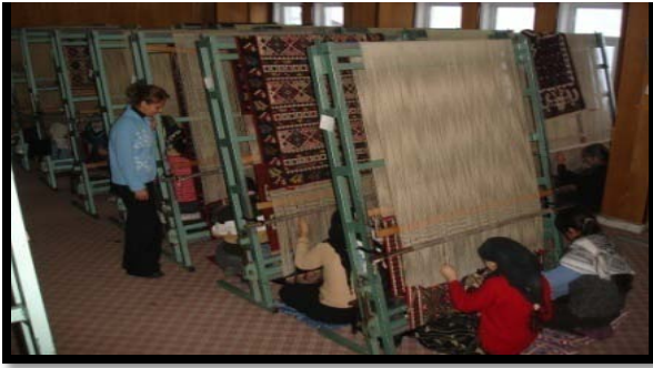
Şekil 11. Kilim Dokuma

Kültürel anlamda da Şırnak ili gerek yemek kültürü, gerekse giyim ve el sanatları kendisine özgü değerlerle oldukça zengindir.