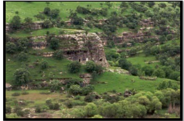
Şekil 4.Guti Harabeleri