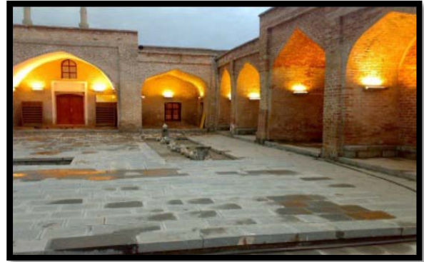
Şekil 8. Kırmızı Medrese

Ayrıca Şırnak'ın ilçelerinden biri olan İdil, hem inanç turizmi hem de tarihi yapılar açısından önemli bir yere sahiptir. İdil'de yüzyıllardan bu yana çoğunlukla Yezidi ve Süryani inancına sahip insanlar yaşamaktadır. Bu inançlarından dolayı geçmişten günümüze 17 tarihi kilise kalmıştır. İdil bu özelliğinden ile Hıristiyanlar için önemli bir çekim merkezi konumundadır. Kiliselerden şu an için yalnızca 1 tanesi faal durumdadır.