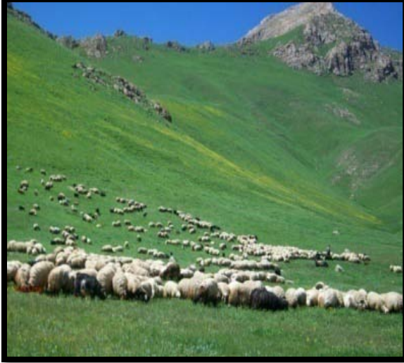
Şekil 5.Feraşın Yaylası

Feraşın Yaylası; Beytüşşebap ilçesinde bulunan FeraşınYayla'sı görülmeye değer bir yerdir. Yayla her yaz geleneksel olarak düzenlenen Kuzu Kırpma Şenliklerine yöre halkı ve çevre illerden birçok kişi katılmaktadır. Aynı zamanda Beytüşşebap'ta yetişen ters lale görenleri şaşırtan bir güzelliğe sahiptir.