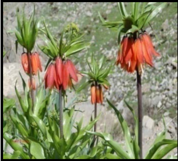
Şekil 6. Ters Lale