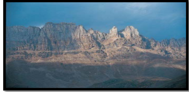
Şekil 2.Cudi Dağı

doğa güzelliklerinin olduğunu görmekteyiz. Bu yerlerin turizmde kullanılması başta yöre halkına olmak üzere ülkeye fayda sağlayacaktır. Karacadağ (3275m), Altın dağ (3358 m) ve Cudi Dağı (2114m) yükseklikleri ile dağcılık turizmi potansiyeline sahiptirler. KızılsuÇayı'nda olta balıkçılığı yapılmaktadır. Bunun yanında Cudi Dağı'nda çok çeşitli bitkilerin olması Cudi Dağı'nın botanik turizm açısından değerlendirilmesine olanak sağlamaktadır (www.kultur.gov.tr). Cudi aynı zamanda Nuh tufanından sonra geminin oturduğu dağ olarak ta çok önemli bir çekim gücüne sahiptir.